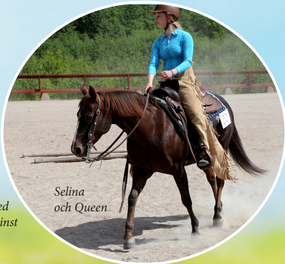
Selina och Queen

Och tänk vad mycket vi har hunnit med i klubben redan under året. Westerngala, Årsstämma med Yoga, Träningar, Regelbokskurs med bedömningsritter och inte minst Dala Western Games.