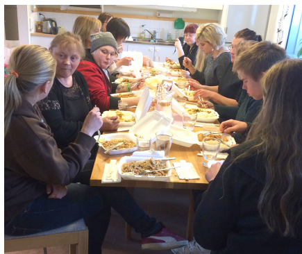
Thaimaten smakade väldigt bra efter några timmar på skolbänken.